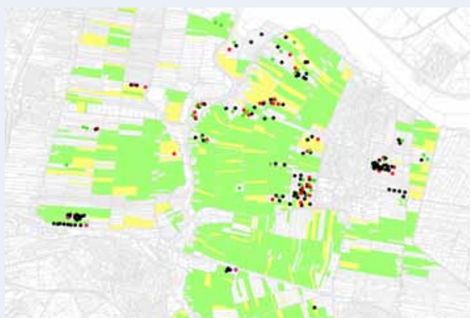
Figuur 2 - Overzicht van nestlocaties op percelen zonder SNL-overeenkomst in Bunschoten en Eemnes